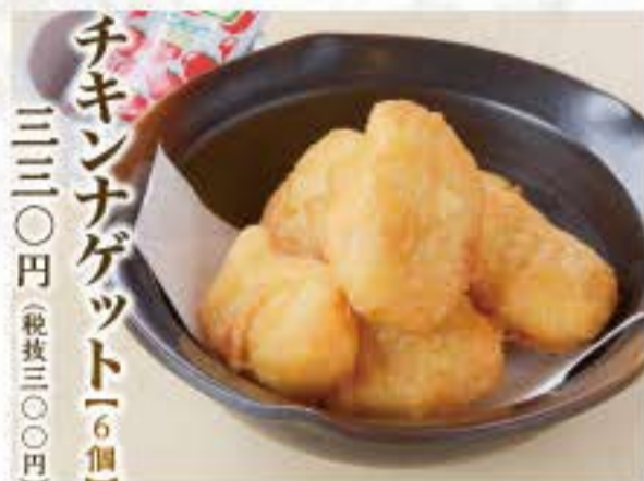
チキンナゲット(6個) 三三〇円(税抜三〇〇円)