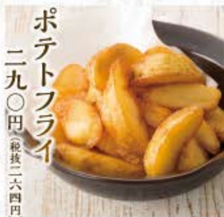
ポテトフライ 二九〇円(税抜二六四円)