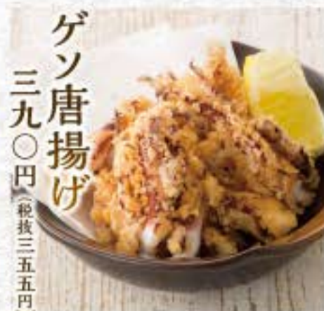
ゲン唐揚げ 三九〇円(税抜三五五円)