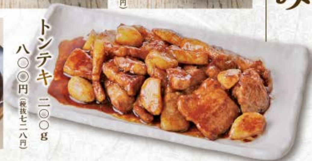
トンテキ 二〇〇g 八〇〇円(税抜七二八円)