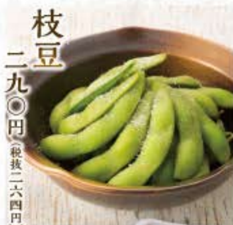
枝豆 二九〇円(税抜二六四円)